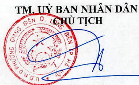
Đặng Thúy Vân